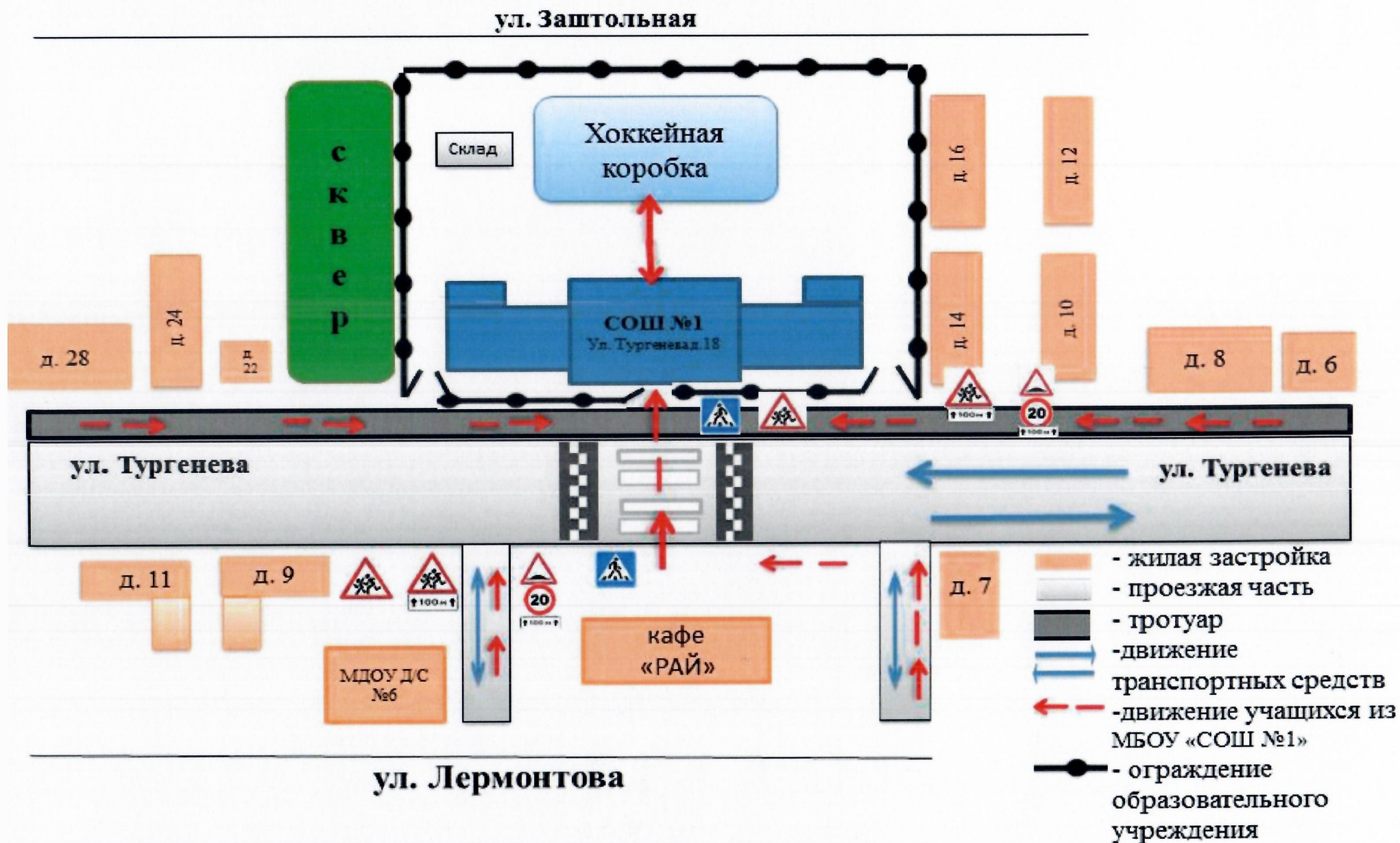
Схема организации дорожного движения в непосредственной близости от МБОУ «СОШ №1» ПГО с размещением соответствующих транспортных средств, маршруты движения детей (учеников) и транспортных потоков.