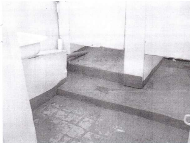
Фото №5: Санитарно-гигиенические помещения

Комментарий к заключению: в связи с невозможностью доступа инвалидов колясочников на второй и третий этаж, необходимо в ходе текущего ремонта выполнить мероприятия по обеспечению доступности для инвалидов – колясочников, с поражением опорно-двигательного аппарата, одной из туалетных комнат на первом этаже.