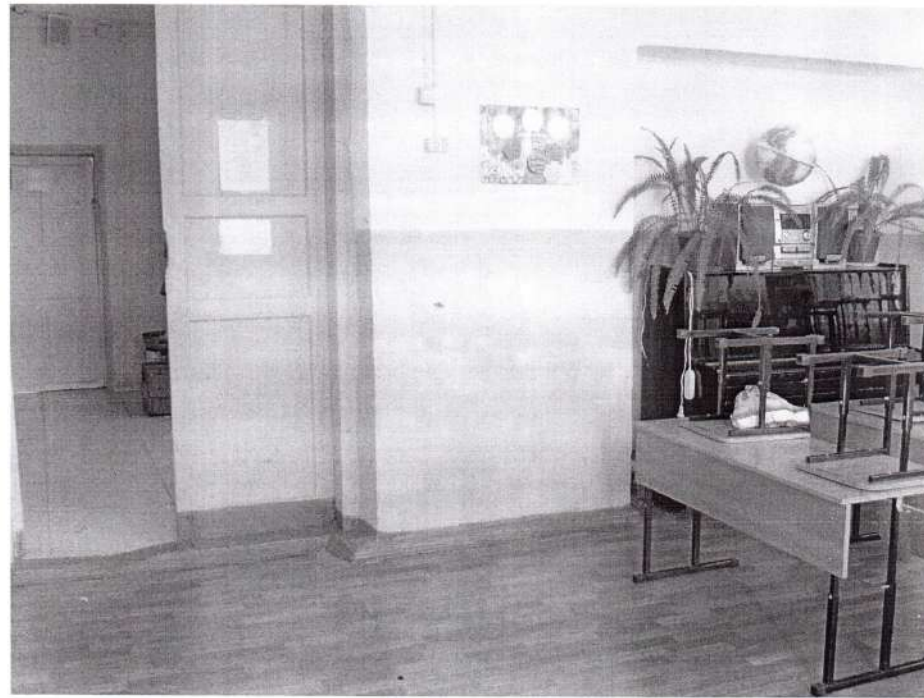
Фото №4: Кабинетная форма обслуживания