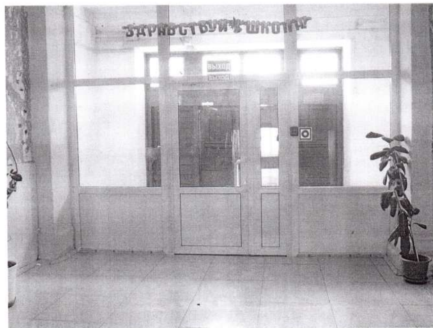
Фото.№3: Пути (путей) движения внутри здания

Комментарий к заключению: необходима установка поручней и пандуса на лестнице первого этажа