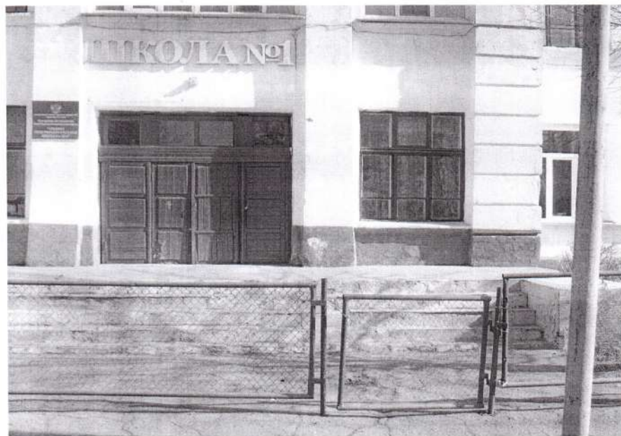
Фото №1: Территории, прилегающей к зданию (участка)